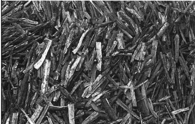
地域資源としてのバイオマス

農林水産省は3月28日、関係7府省によるバイオマス産業都市として、新たに北海道釧路市、北海道興部町、宮城県南三陸町、静岡県浜松市、三重県津市、島根県奥出雲町、岡山県真庭市、岡山県西粟倉村の8地域を選定した。